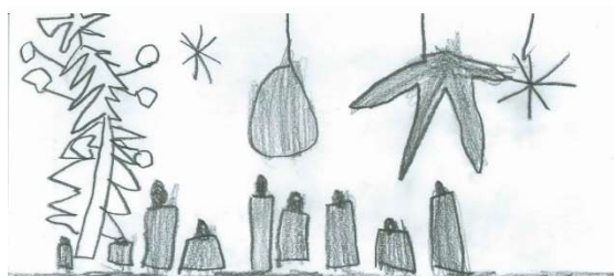
Nakreslila Markétka Žáková, 5 roků